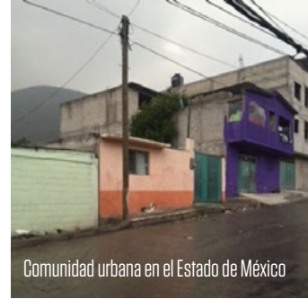
Comunidad urbana en el Estado de México